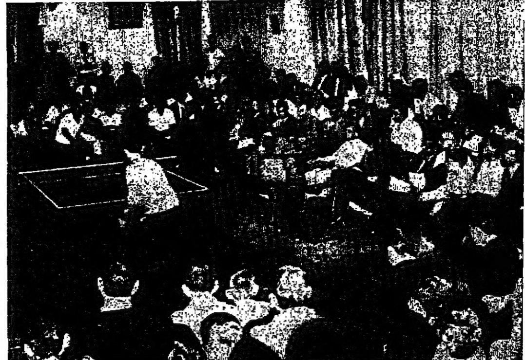
سور المدير العام مؤسسة رعاية الشباب وسيدة الامم المؤسسة وتوفيق من الشباب الورد في مسكر العمل الدولي يشاهدون جارية بطولتس الطويلة

عمل - في الاسبوع الاول مسكن جيم العمل الدولي بعد ان تمسكوا المشركون فيه بعمل خيس سماعت يوميا في منطقة الافوار في جو وصلت درجة الحرارة فيه الى ٤٦ درجة مئوية منذ الظهر ، وقد ابدى الطلاب المتشركون في المسكر من اجانب واردين حاسا بالغا واقبالا شديدا على العمل ، وقد قامت اول امس وفد الطلبة المشتركة بفتح العمل الدولي بمجالس زيارة لدية عازاروا خلالها الجامعة الاردنية والبنات المركزي لم الحف الاردني في المنطقة حيث تطولوا هناك على محتويات من القطع الاثرية الفاترة والخطوط القديمة ثم اصيبت لهم بعد ذلك فرصة التبول في البنية للاطلاع والتعرف على احيائها .